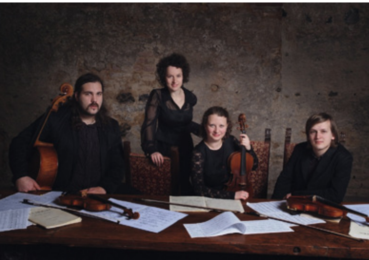
Das „Asasello Quartett“ spielt Conlon Nancarrow's Streichquartett Nr. 3 und Ludwig van Beethovens Streichquartett B-Dur, op. 130 & Große Fuge, op. 133.

Freitag, den 10. August 2012 Beginn: 19:30 Uhr | Eintritt: 12,- EUR