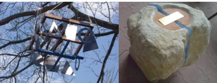
„Klangskulptur“ von Carmen Repinski

Täglich Mai bis Oktober 2012 zu den regulären Öffnungszeiten