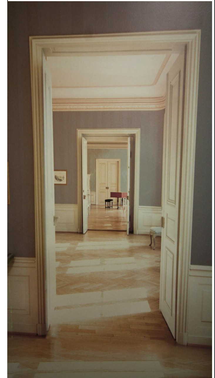
Detailansichten der Station 67