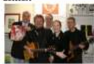
Kleine Herzen Hannover e. V.