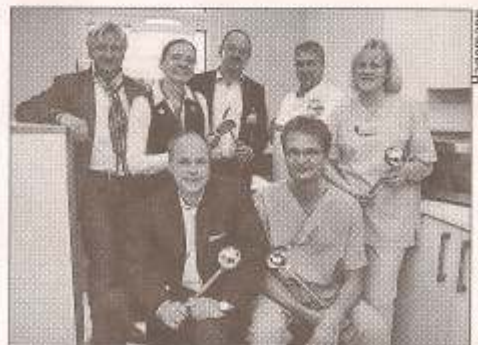
Froh über die neue Küche: Die MHH-Mitarbeiter mit den Förderern der Kinderherzstation.

Die neue Stationsküche ist Teil des schrittweisen Umbaus der Kinderherzstation, der nach den Plänen der MHH bis Mai 2013 abgeschlossen sein soll. In den vergangenen Monaten sind schon acht Räume zu familienfreundlichen Eltern-Kind-Zimmern umgebaut worden, sieben weitere sollen folgen. Die Kosten der gesamten Renovierung der Station werden dabei zum Teil von der MHH getragen, jeweils um die 200 000 Euro übernehmen die Vereine „Kleine Herzen“ und „Kinderherz“.