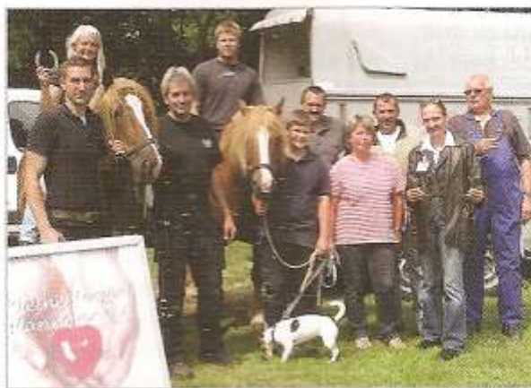
Ein Herzensteam: Die Hufbeschlagsschmiede auf der Pferd & Jagd in Hannover.

Umgebung sehr wichtig.“ Auf Initiative des Vereins kümmert sich inzwischen eine Psychologin um die Familien. Ein Beratungszimmer wurde eingerichtet, die Stationsküche und der Stationsflur